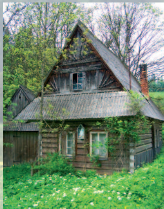
Pełna uroku zabudowa Gliczarowa.