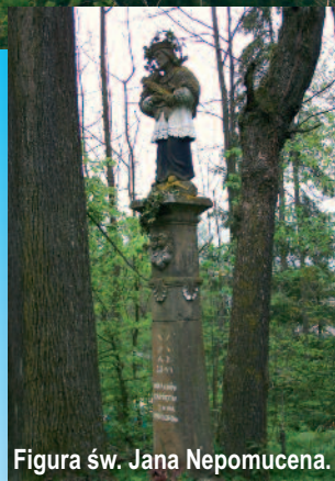
Figura św. Jana Nepomucena.