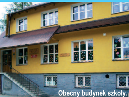
Obecny budynek szkoły.