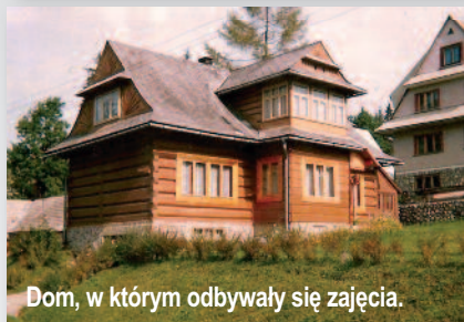
Dom, w którym odbywały się zajęcia.