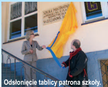
Odsłonięcie tablicy patrona szkoły.

Uczniowie naszej szkoły systematycznie zdobywają wiedzę o naszej małej ojczyźnie na dodatkowych zajęciach z wychowania regionalnego, obejmujących muzykę, plastykę, historię regionu, tradycje i zwyczaje. Dzięki temu biorą