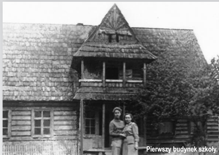
Pierwszy budynek szkoły.