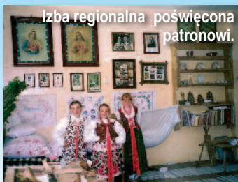
Izba regionalna poświęcona patronowi.

Szkoła Podstawowa im. Wojciecha Kulacha Wawrzyńcoka