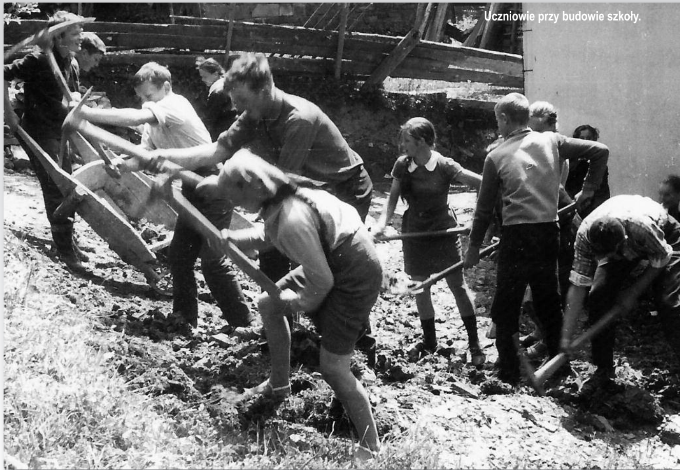
Uczniowie przy budowie szkoły.

Przez cały okres istnienia szkoły prowadzona jest kronika szkolna, w której zapisuje się najważniejsze wydarzenia z życia szkoły i wsi.