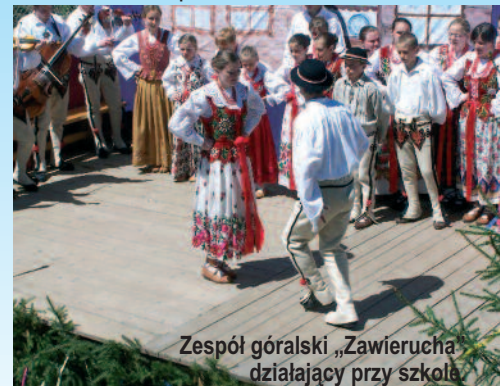
Zespół góralski „Zawierucha” działający przy szkole

Rok 2010 to rok jubileuszowy – rok spotkań, wspomnień i głównych uroczystości, zaplanowanych na 25 września, podczas których odbędzie się poświęcenie sztandaru szkoły ufundowanego przez mieszkańców wsi przy współudziale OSP z Gliczarowa Dolnego.