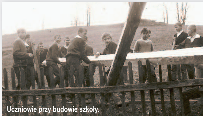
Uczniowie przy budowie szkoły.