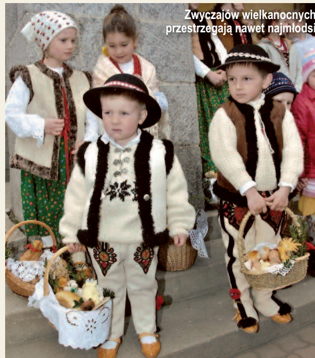
Zwyczajów wielkanocnych przestrzegają nawet najmłodszy

wowej Nr 2 funkcjonuje „Małe Podhale”. Kultywowanie folkloru wzięło na siebie m.in. Gminny Ośrodek Kultury w Białym Dunajcu. Efekty można zobaczyć i usłyszeć na takich imprezach jak: Przegląd Młodych Gwędziarzy i Recytatorów im. Andrzeja Skupnia-Florka, Podhalański Festiwal Papięski, Parada Gazdowska, Wielkanocna Kosotocka – konkurs na najpiękniejszy i najbardziej tradycyjny koszyk ze święconym odbywający się w Wielką Sobotę, Konkurs Młodyk Toniecników, czy roczne dzielenie się opłatkiem i jajkiem święconym oraz tradycyjne posiadły góralskie. Znakomitą okazję do poznania walorów kulturalnych i krajobrazowych regionu podhalańskiego stwarza Ogólnopolski Podhalański Rajd Narciarski LZS.