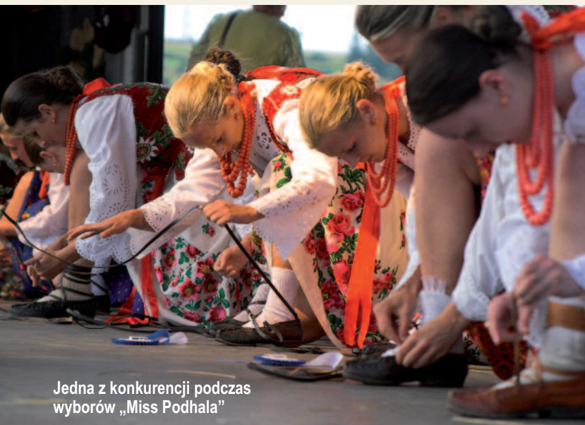
Jedna z konkurencji podczas wyborów „Miss Podhala”