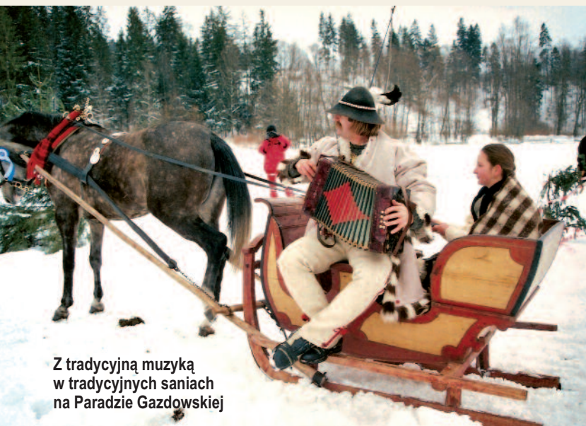
Z tradycyjną muzyką w tradycyjnych saniach na Paradzie Gazdowskiej