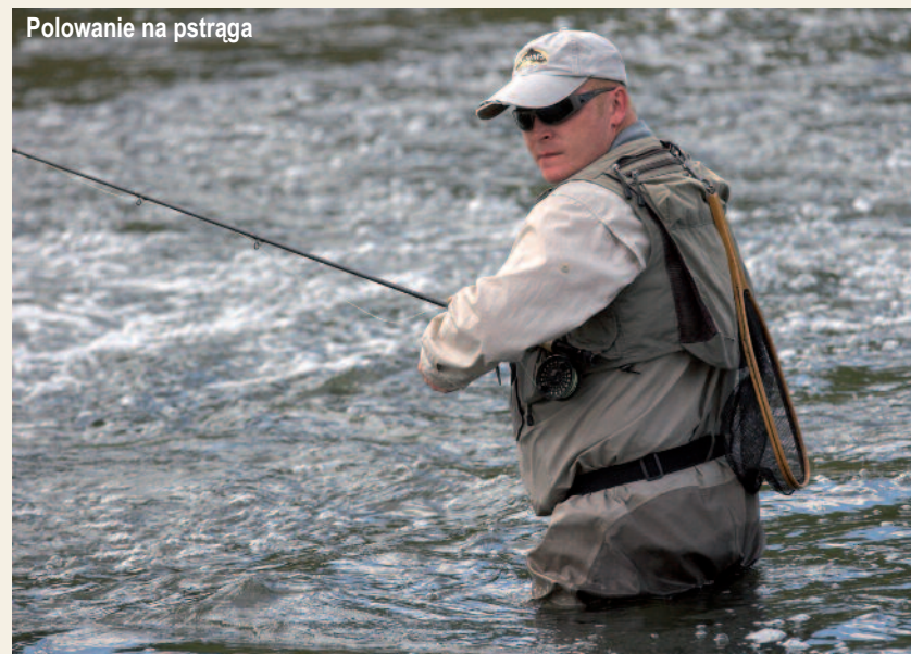
Polowanie na pstrąga