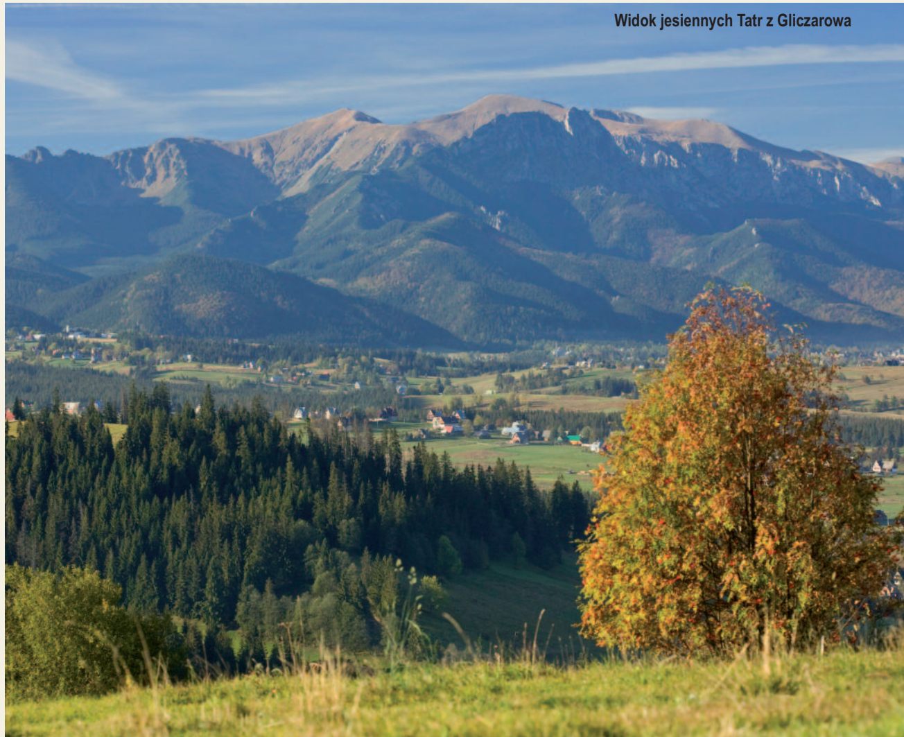
Widok jesiennych Tatr z Gliczarowa

Na terenie całej gminy znajdują się góralskie pensjonaty, w których na gości czeka prawie 2000 miejsc noclegowych. Rozwój gminy nastawiony jest przede wszystkim na agroturystykę, z jednoczesnym propagowaniem zdrowej żywności.