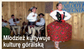
Młodzież kultywuje kulturę góralską