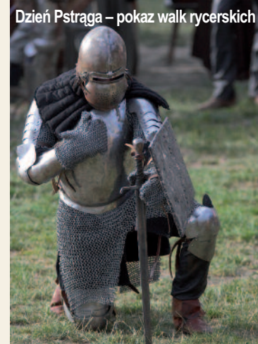
Dzień Pstrąga – pokaz walk rycerskich