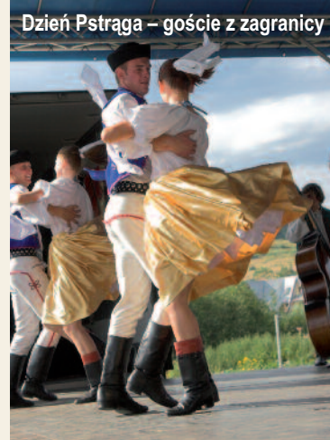
Dzień Pstrąga – goście z zagranicy